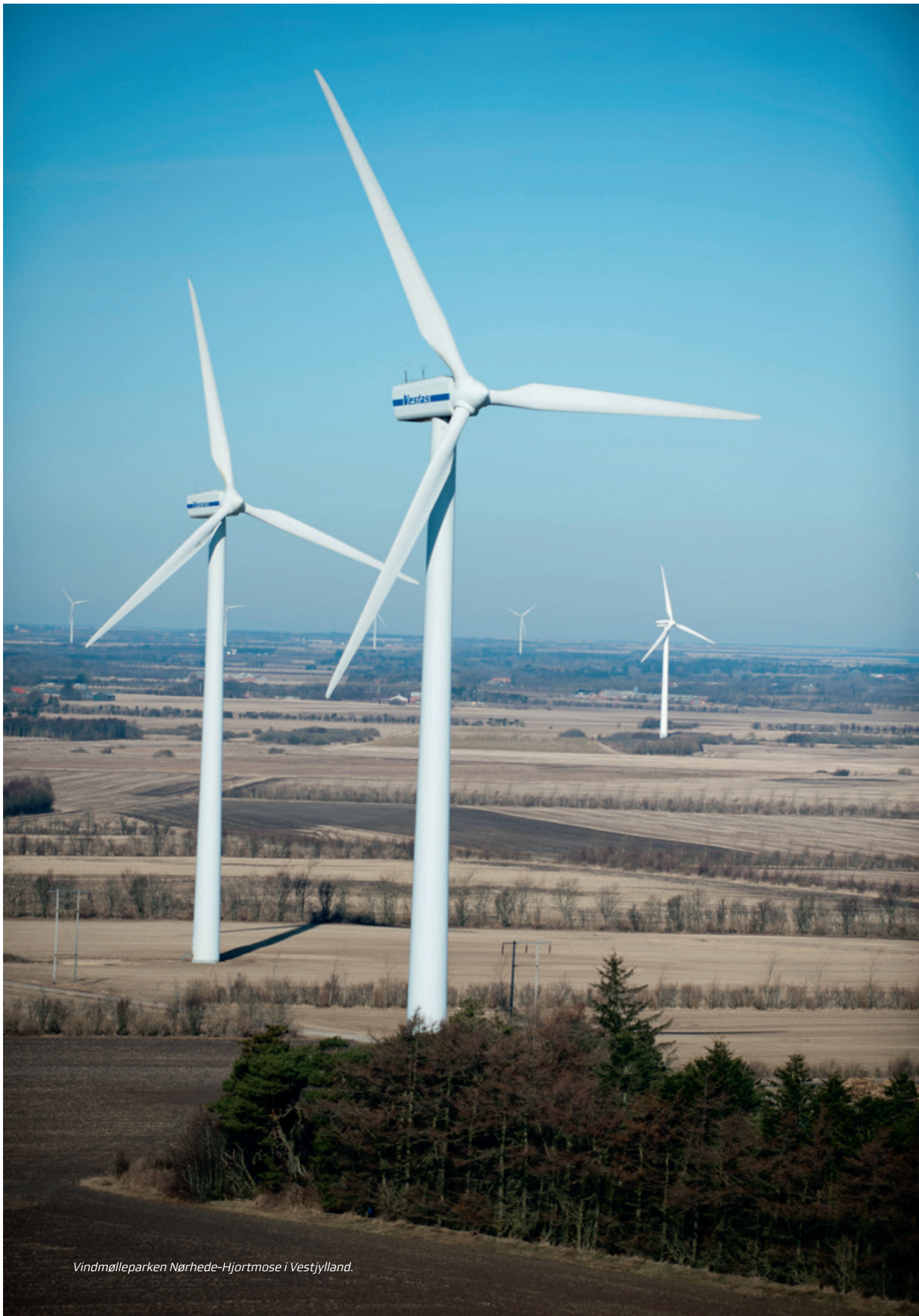
Vindmølleparken Nørhede-Hjortmose i Vestjylland.